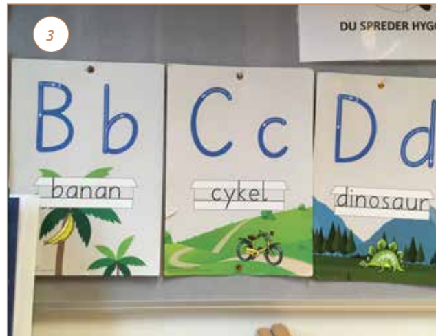
Man kan koble bogstaver til forskellige ord, hvor C er C som i Chimpanse ... eller som i Cykel

Vi har set skoler og tilknyttede børnehaver, der bruger det samme bogstavsystem og hvor børnene lærer bogstavernes lyde og det tilhørende ord. De får lov til at lege med bogstaverne i børnehaven og når de møder dem igen i skolen, er det stadig L som i Løve.