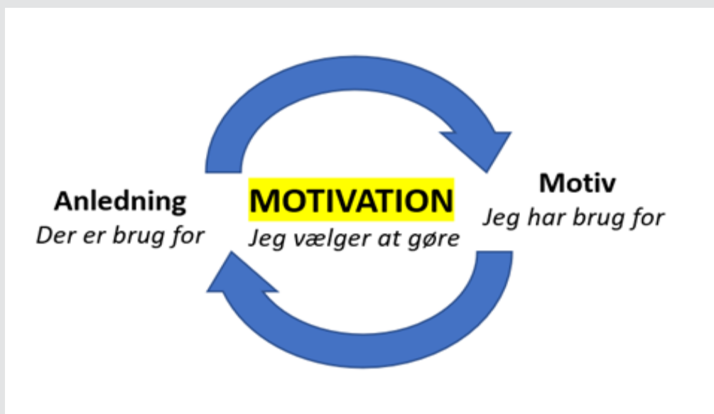
Figur 3.1 Motivationens dynamikker