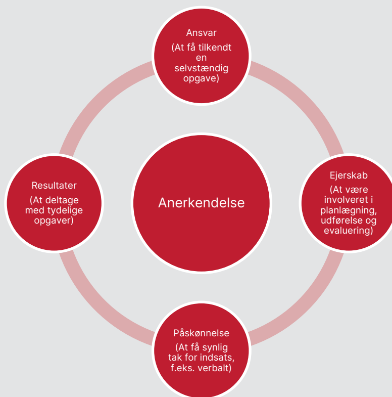
Figur 4.1 Indholdet af anerkendelse

En norsk undersøgelse (Sirris, 2022) af frivilliges engagement i de norske folkekirker viser, at anerkendelsen kan angå fire dimensioner. De fire dimensioner er samlet i Figur 4.1. For det første er der en anerkendelse knyttet til at få ansvar for at løse en opgave. For det andet er ejerskab gennem involvering vigtigt for at opleve at blive anerkendt. En tredje dimension angår påskønnelse , hvor det eksempelvis er vigtigt at få synlig tak for en indsats, hvilket knytter sig til den fjerde og sidste dimension om at blive anerkendt for opnåede resultater .