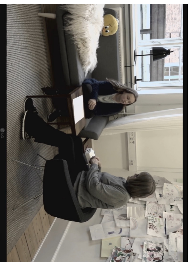
Modelfoto. Videoafhøring i Børnehus Hovedstaden, København.